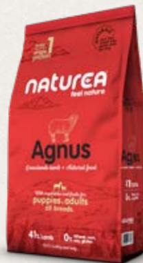
Taille des croquettes